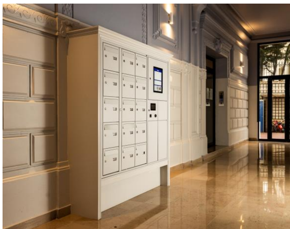
Hall d'entrée connecté – Paris Vème

Face à un marché de la livraison en pleine mutation, désireux d'en anticiper les tendances, Decayeux s'adapte. Si la réception de courrier diminue, la livraison de colis a le vent en poupe, boostée par l'essor du e-commerce. Porté par cette tendance, DECAYEUX s'intéresse aux enjeux de la « smart city » et imagine dès 2015 des solutions digitales répondant aux attentes et usages. A l'image de MyColisBox, une boîte à colis connectée récompensée au CES Las Vegas, ou encore MyConnectHall, un hall d'entrée 100% connecté offrant aux habitants une multitude de services et une nouvelle façon de vivre. L'entreprise se tourne ainsi vers l'industrie 4.0 et développe une part de marché significative dans le domaine des produits connectés.